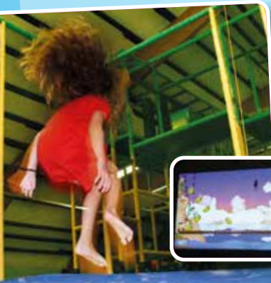
CYBER JUMP (einzigartig in Deutschland)